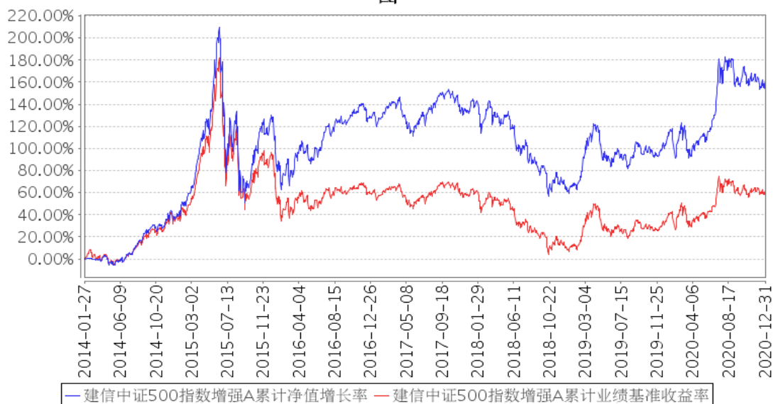
建信中证500指数增强A累计净值增长率与同期业绩比较基准收益率的历史走势对比图