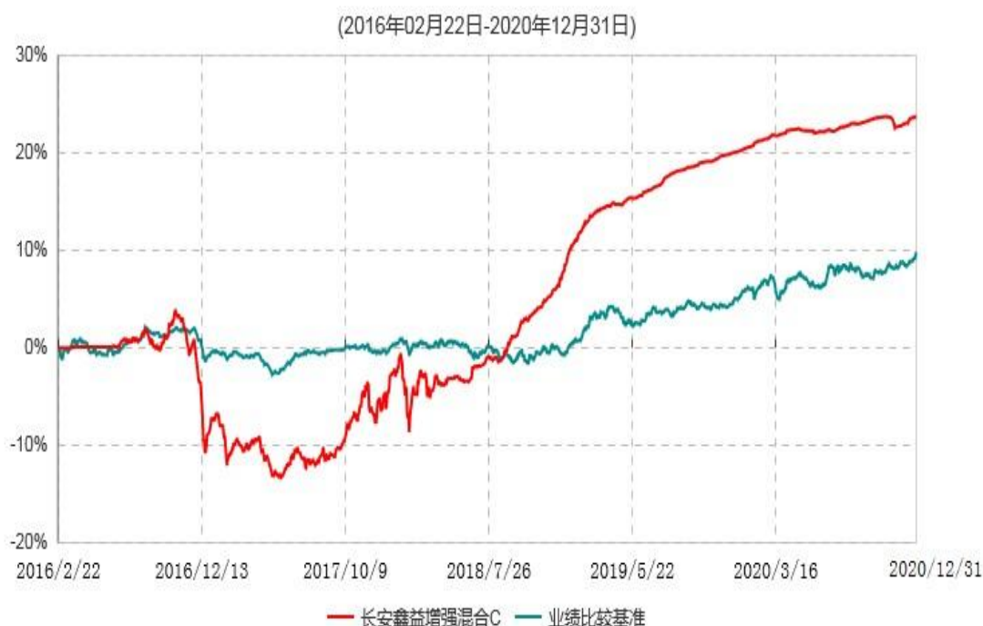
长安鑫益增强混合C累计净值增长率与业绩比较基准收益率历史走势对比图

根据基金合同的规定,自基金合同生效之日起 6 个月内基金各项资产配置比例需符合基金合同要求。本基金在建仓期结束后,各项资产配置比例已符合基金合同有关投资比例的约定。基金合同生效日至报告期末,本基金运作时间超过一年。图示日期为 2016 年 02 月 22 日至 2020 年 12 月 31 日。