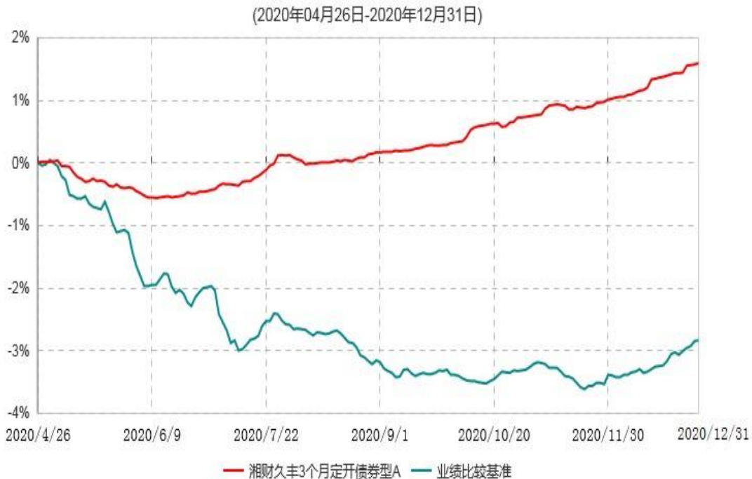
湘财久丰3个月定开债券型A累计净值增长率与业绩比较基准收益率历史走势对比图