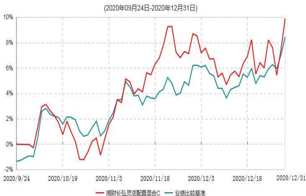
湘财长弘灵活配置混合C累计净值增长率与业绩比较基准收益率历史走势对比图