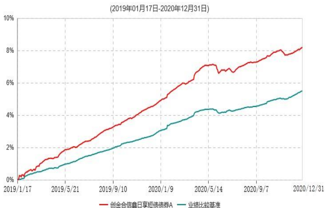
创金合信鑫日享短债债券A累计净值增长率与业绩比较基准收益率历史走势对比图