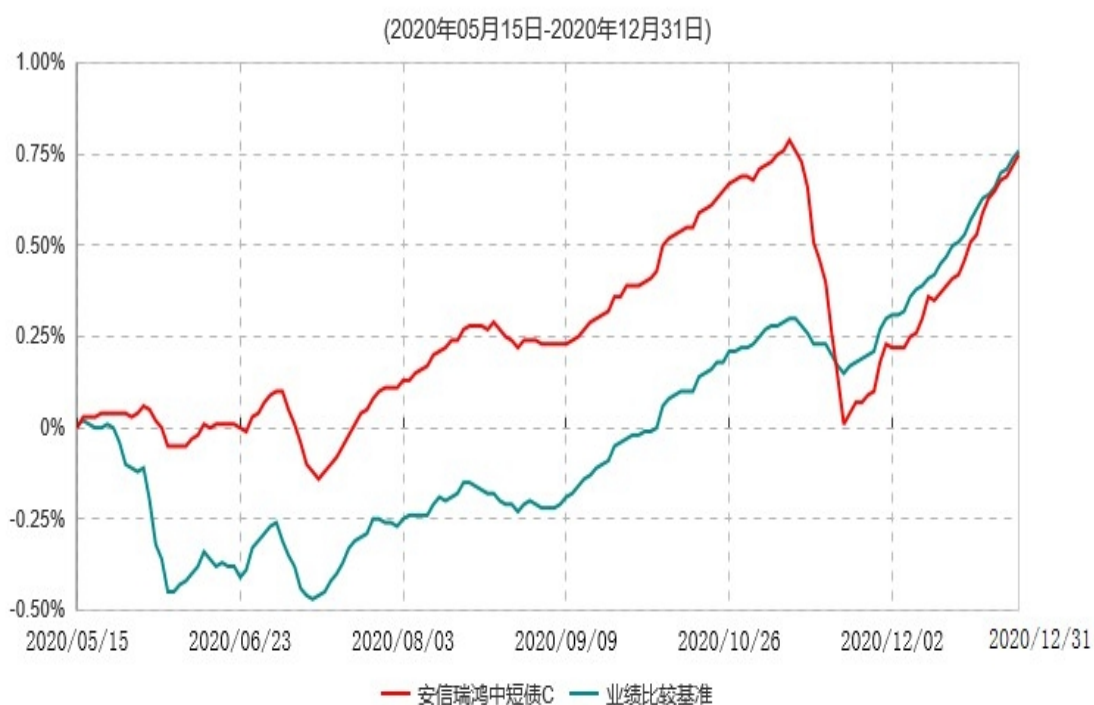
安信瑞鸿中短债C累计净值增长率与业绩比较基准收益率历史走势对比图

注：安信瑞鸿中短债 C（970005）5 月 14 日尚未开放申赎，无计划份额，2020 年 5 月 14 日净值不进行披露。