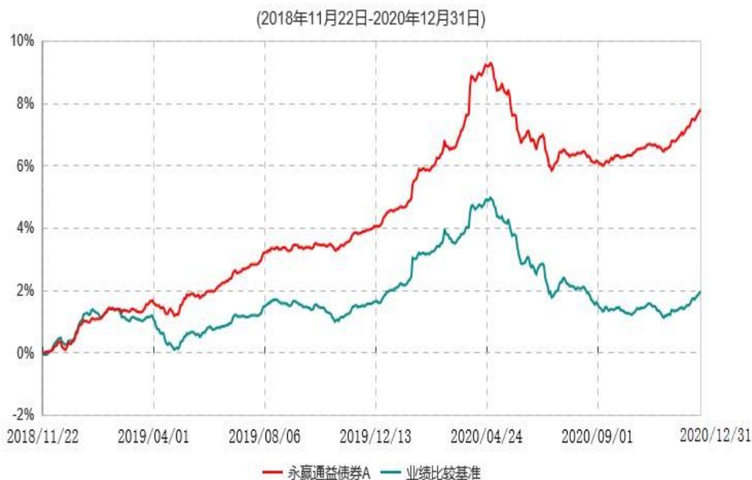
永赢通益债券A累计净值增长率与业绩比较基准收益率历史走势对比图