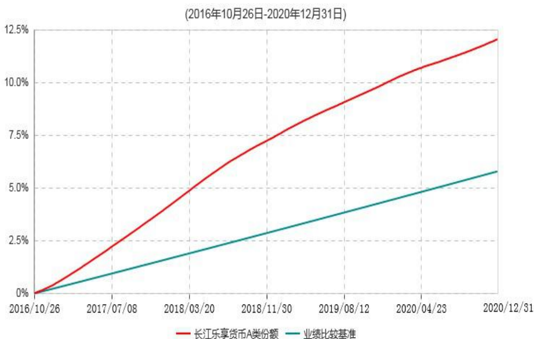
长江乐享货币A类份额累计净值收益率与业绩比较基准收益率历史走势对比图