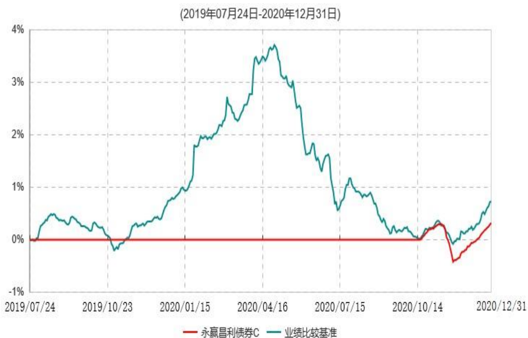
永赢昌利债券C累计净值增长率与业绩比较基准收益率历史走势对比图