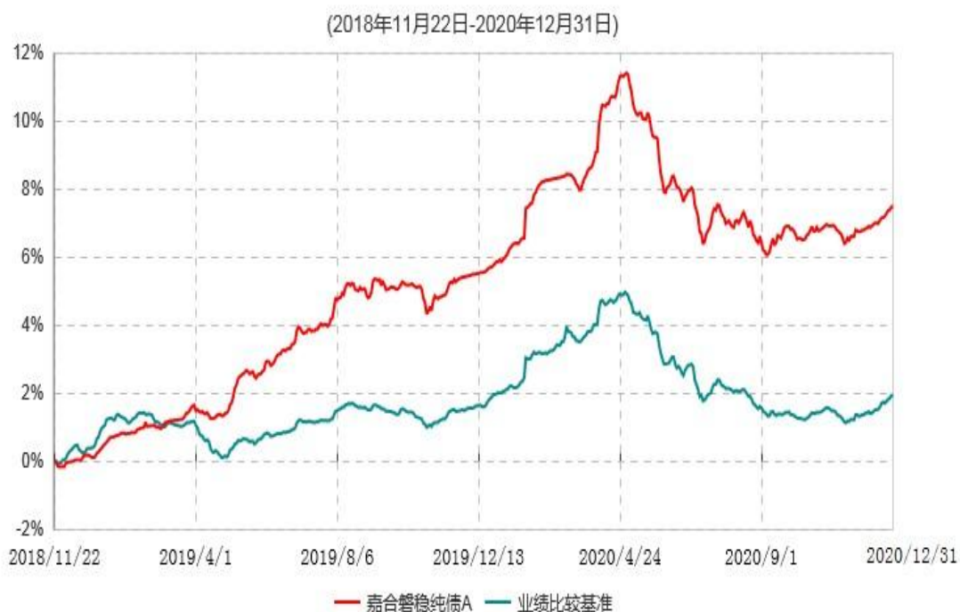
嘉合磐稳纯债A累计净值增长率与业绩比较基准收益率历史走势对比图