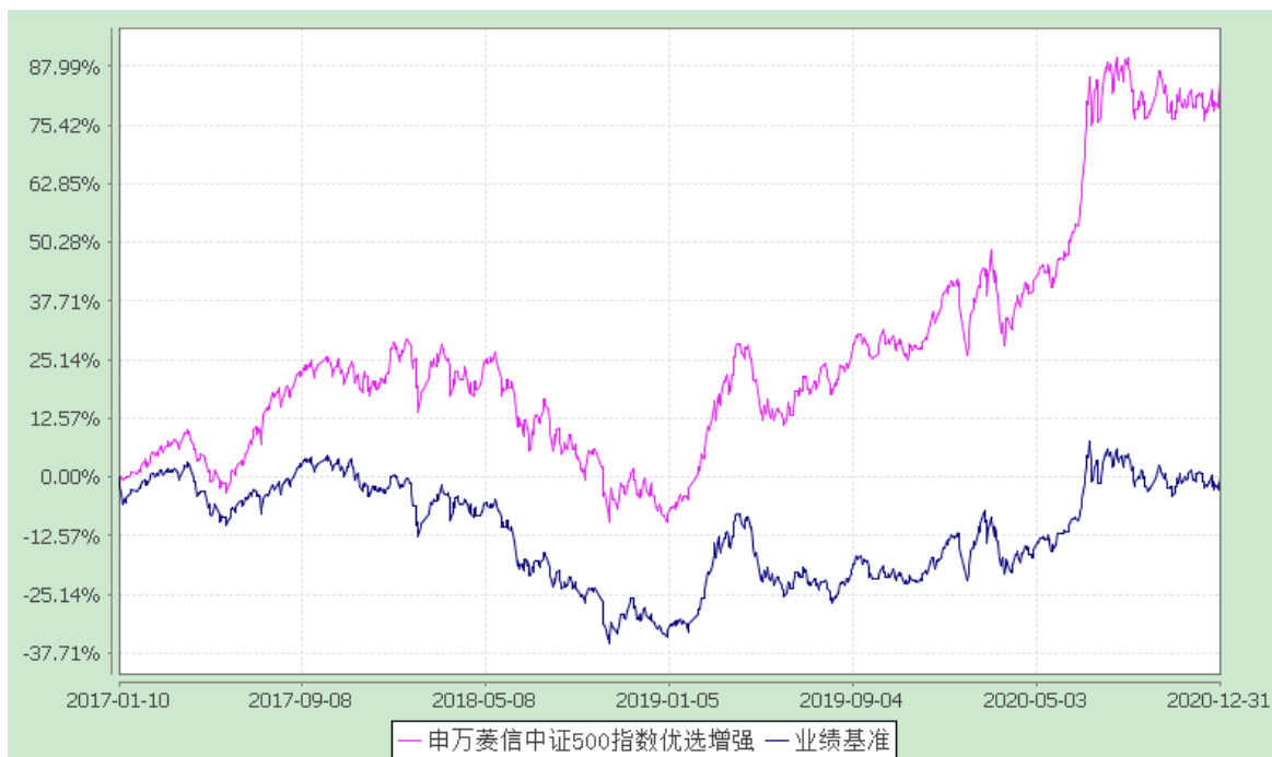
申万菱信中证 500 指数优选增强 C