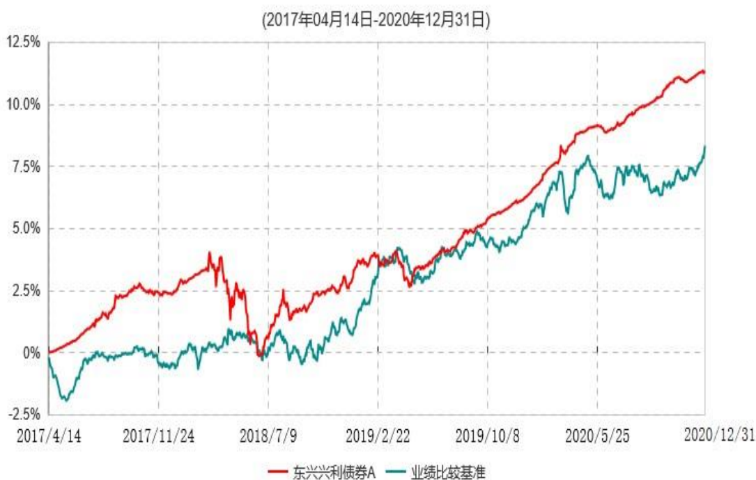
东兴兴利债券A累计净值增长率与业绩比较基准收益率历史走势对比图