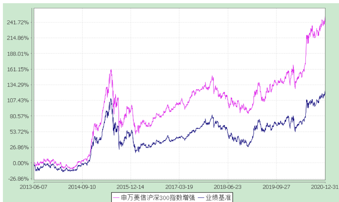
申万菱信沪深 300 指数增强 C