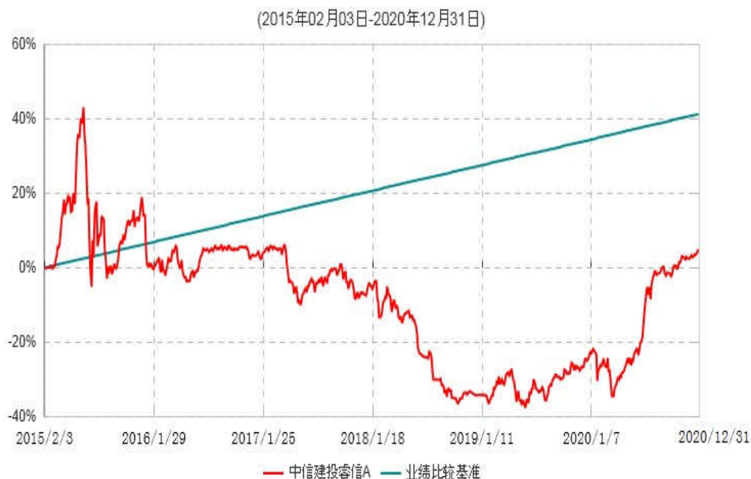
中信建投睿信A累计净值增长率与业绩比较基准收益率历史走势对比图