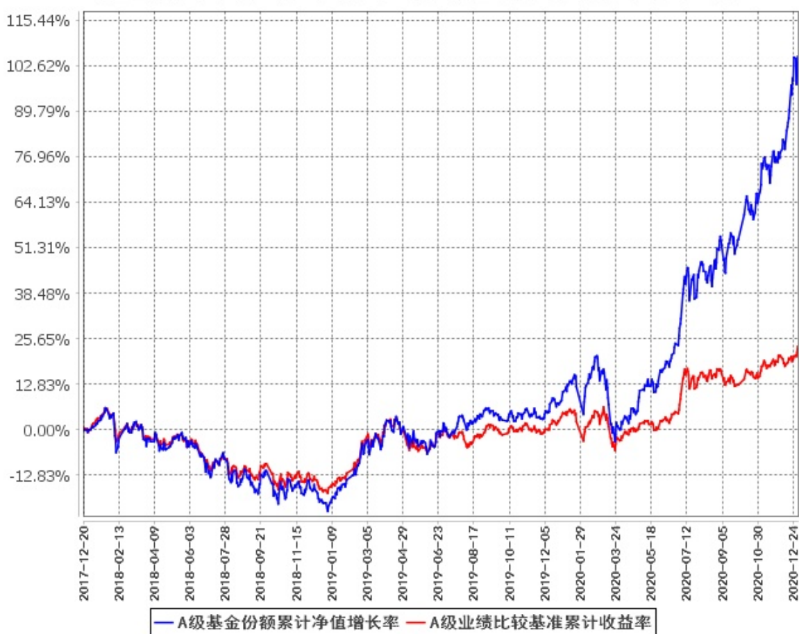
A级基金份额累计净值增长率与同期业绩比较基准收益率的历史走势对比图