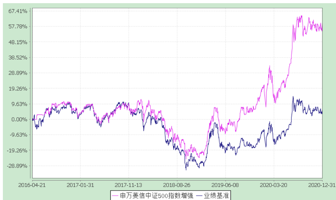
申万菱信中证 500 指数增强 C