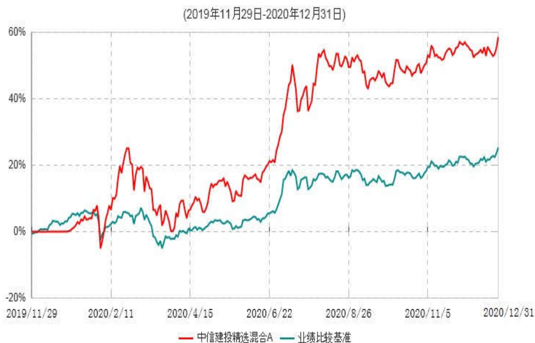
中信建投精选混合A累计净值增长率与业绩比较基准收益率历史走势对比图