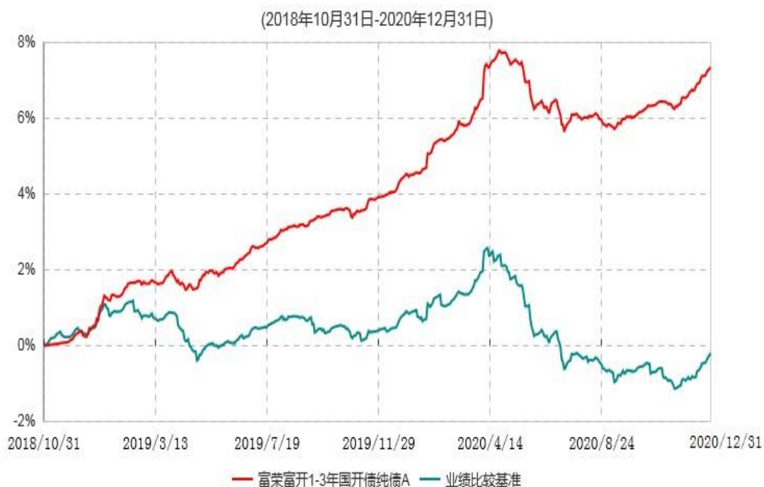
富荣富开1-3年国开债纯债A累计净值增长率与业绩比较基准收益率历史走势对比图