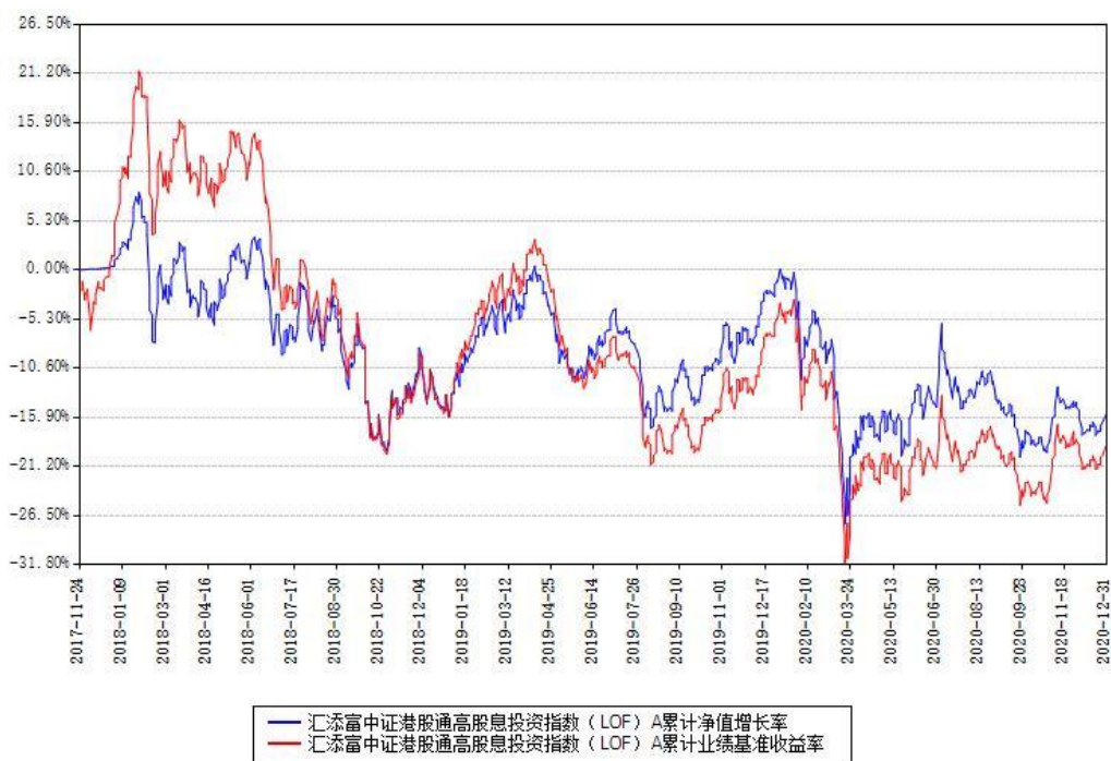
汇添富中证港股通高股息投资指数（LOF）C 累计净值增长率与同期业绩基准收益率对比图