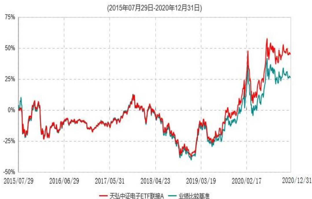
天弘中证电子ETF联接A累计净值增长率与业绩比较基准收益率历史走势对比图