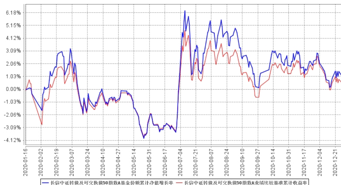
长信中证转债及可交换债50指数A基金份额累计净值增长率与同期业绩比较基准收益率的历史走势对比图