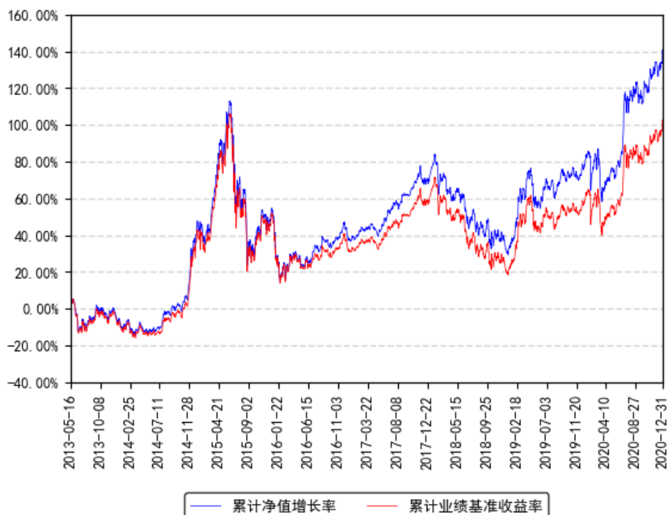
南方沪深300ETF联接累计净值增长率与同期业绩比较基准收益率的历史走势对比图