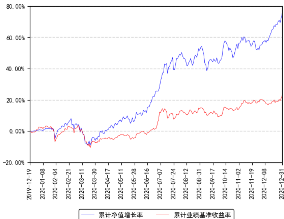
南方 ESG 主题股票 A 累计净值增长率与同期业绩比较基准收益率的历史走势对比图