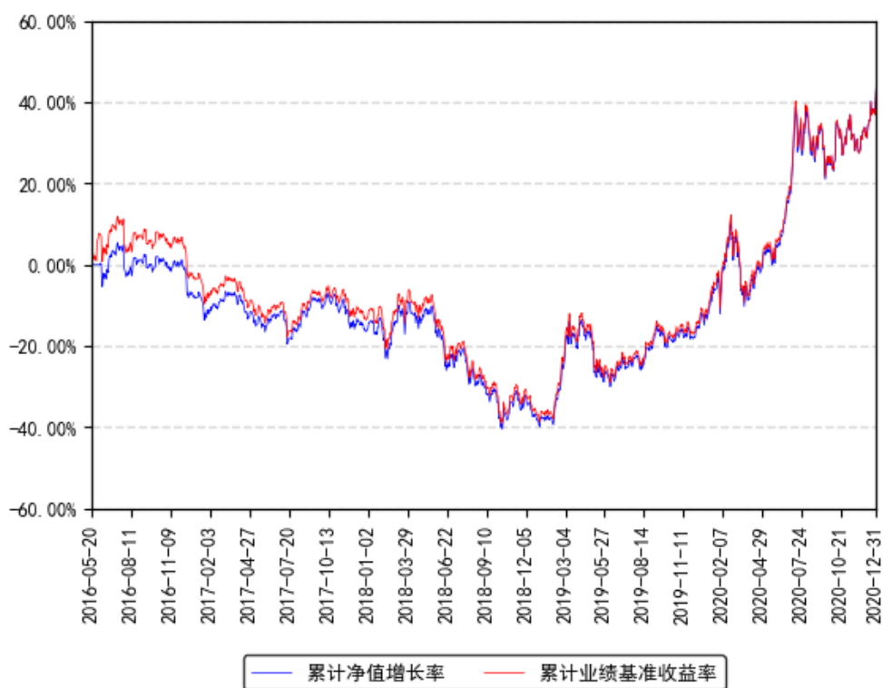
南方创业板ETF联接累计净值增长率与同期业绩比较基准收益率的历史走势对比图