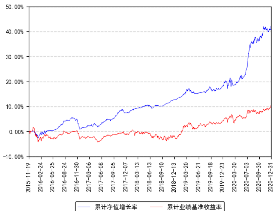
南方荣光灵活配置混合A累计净值增长率与同期业绩比较基准收益率的历史走势对比图