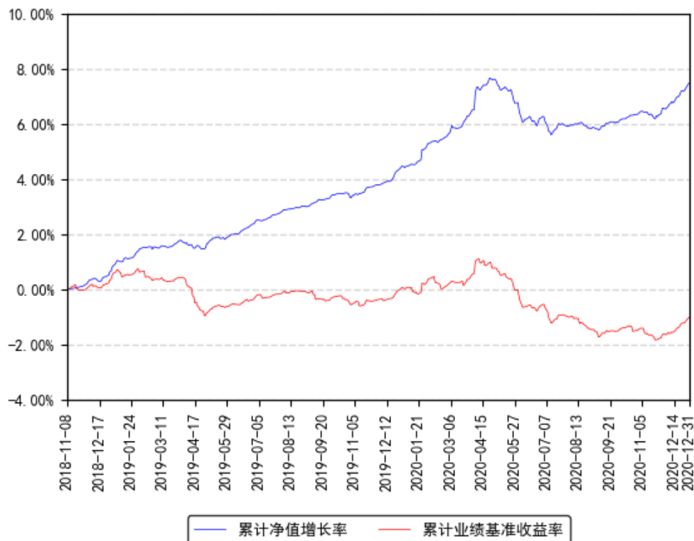
南方1-3年国开债A累计净值增长率与同期业绩比较基准收益率的历史走势对比图