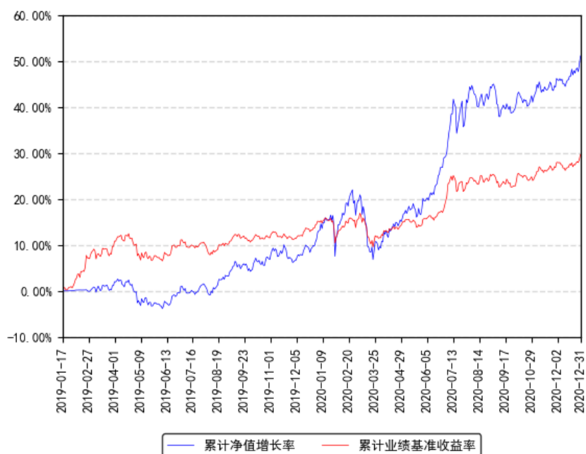
南方合顺多资产配置混合 (FOF) A 级累计净值增长率与同期业绩比较基准收益率的历史走势对比图