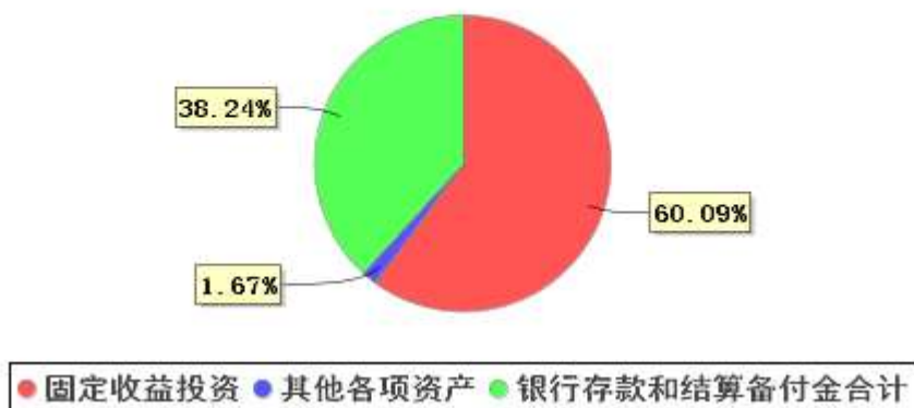
投资组合资产配置图表(2020年12月31日)