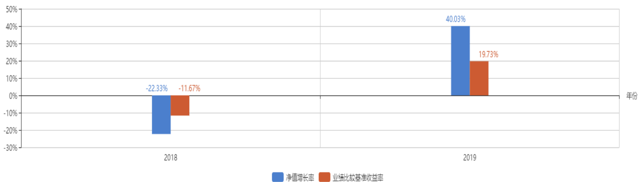
基金每年的净值增长率及与同期业绩比较基准的比较图