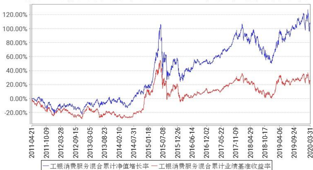
工银消费服务混合累计净值增长率与同期业绩比较基准收益率的历史走势对比图