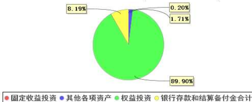
投资组合资产配置图表(2020年6月30日)