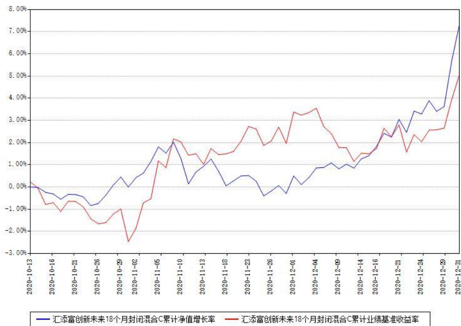
汇添富创新未来18个月封闭混合C累计净值增长率与同期业绩基准收益率对比图