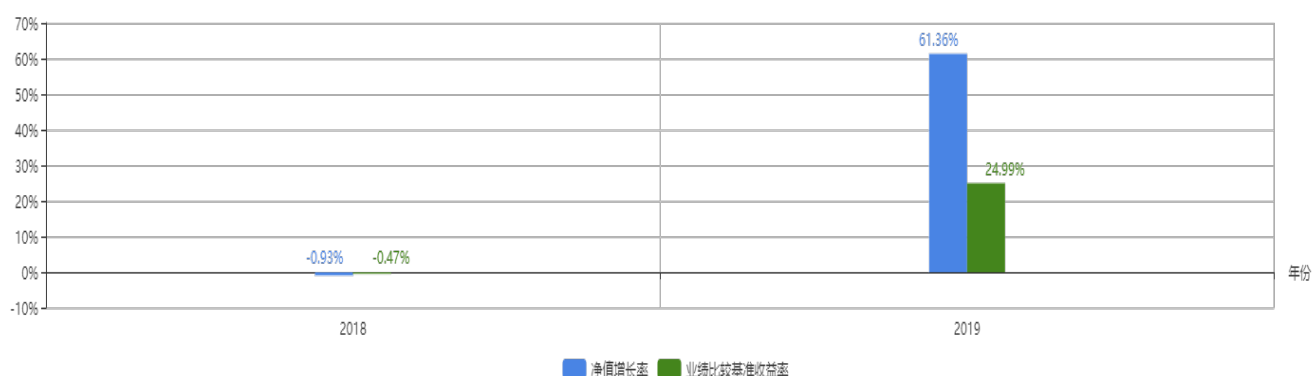
基金每年的净值增长率及与同期业绩比较基准的比较图