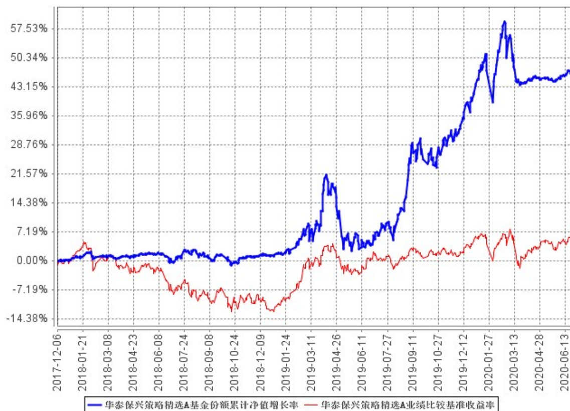
华泰保兴策略精选A基金份额累计净值增长率与同期业绩比较基准收益率的历史走势对比图

2、自基金合同生效以来基金份额累计净值增长率与业绩比较基准收益率历史走势对比(2017年12月6日至2020年6月30日)