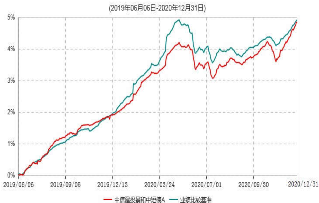
中信建投景和中短债A累计净值增长率与业绩比较基准收益率历史走势对比图