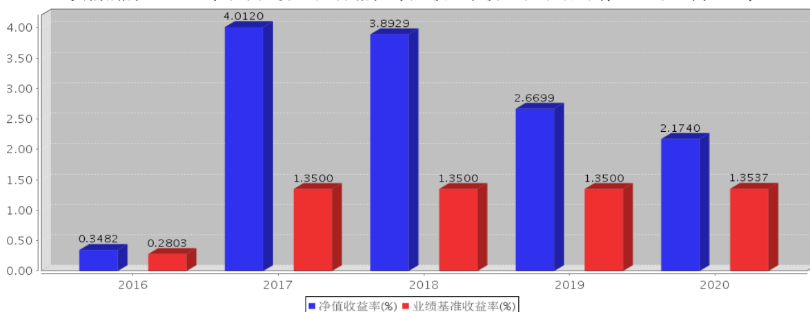
安信活期宝A基金每年净值收益率与同期业绩比较基准收益率的对比图(2020年12月31日)

注: 基金合同生效当年期间的相关数据按实际存续期计算。基金的过往业绩并不代表其未来表现。