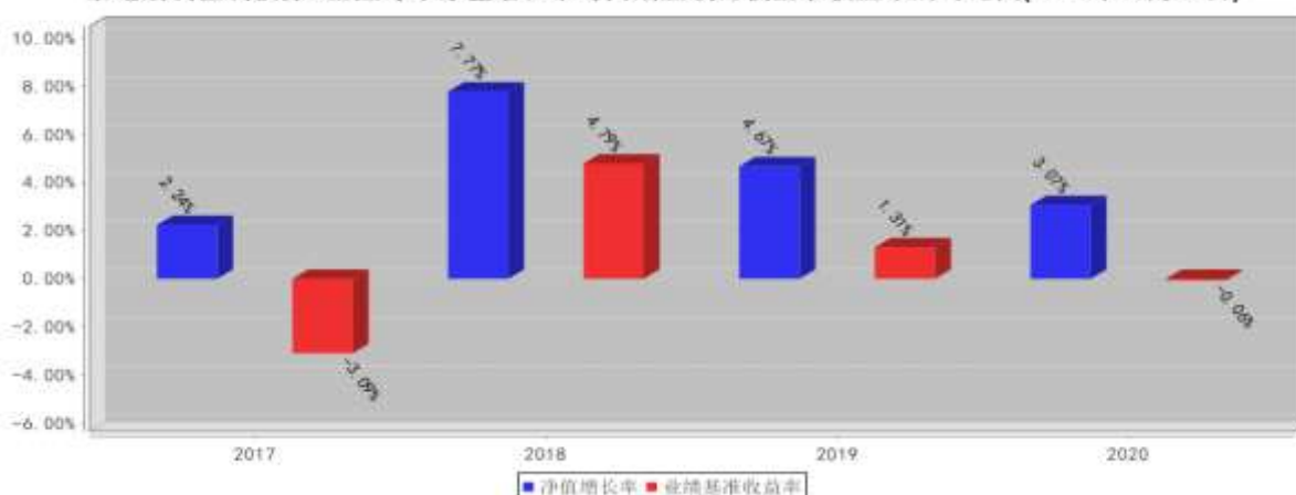
泰达宏利恒利债券A基金每年净值增长率与同期业绩比较基准收益率的对比图(2020年12月31日)

注：本基金合同生效日为2017年1月22日，2017年度净值增长率的计算期间为2017年1月22日至2017年12月31日。基金的过往业绩不代表未来表现。