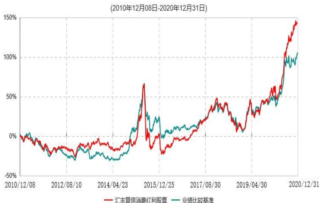
汇丰晋信消费红利股票型证券投资基金累计净值增长率与业绩比较基准收益率历史走势对比图

注：1. 按照基金合同的约定，本基金的投资组合比例为：股票投资比例范围为基金资产的 85%-95%，权证投资比例范围为基金资产净值的 0%-3%。固定收益类证券、现金和其他资产投资比例范围为基金资产的 5%-15%，其中现金（不包括结算备付金、存出保证金、应收申购款等）或到期日在一年以内的政府债券的投资比例不低于基金资产净值的 5%。按照基金合同的约定，本基金自基金合同生效日起不超过 6 个月内完成建仓，截止 2011 年 6 月 8 日，本基金的各项投资比例已达到基金合同约定的比例。