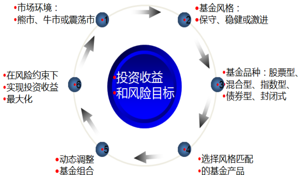
图：基金投资理念解析图

我们构建了一套全面的基金研究体系，为投资提供扎实的研究依据。包括策略研究、品种研究、风格研究、定量研究等，最终的研究成果将转化为基金池。