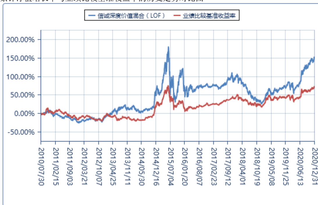
（二）基金累计净值增长率与业绩比较基准收益率的历史走势对比图