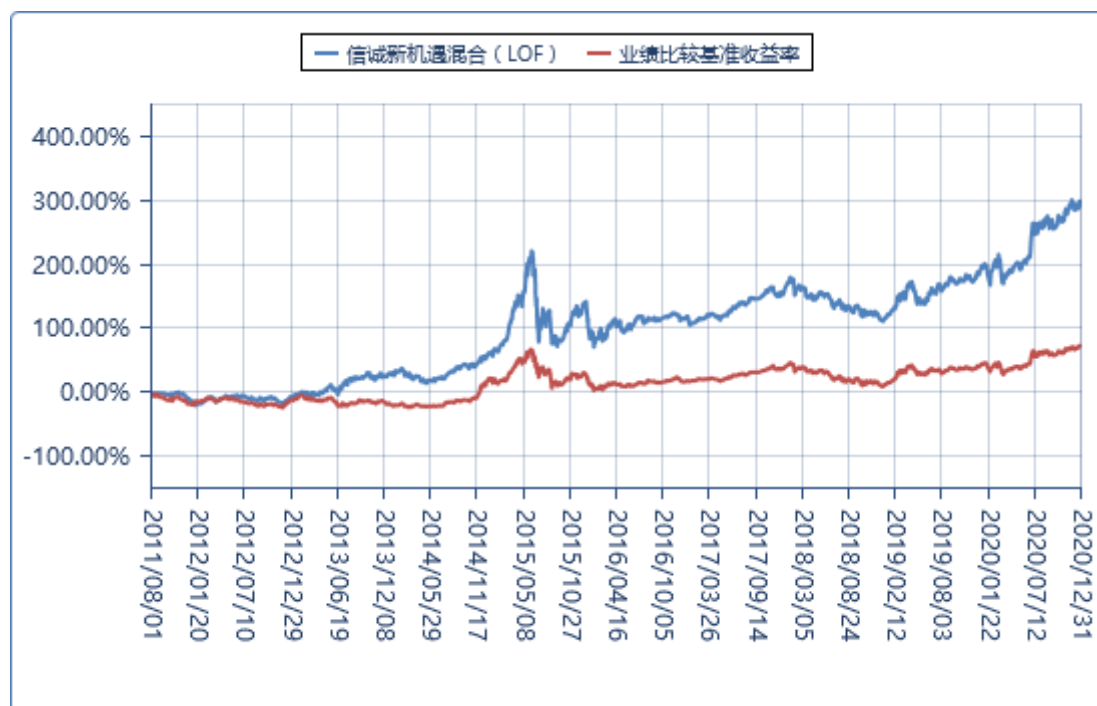
(二) 基金累计净值增长率与业绩比较基准收益率的历史走势对比图