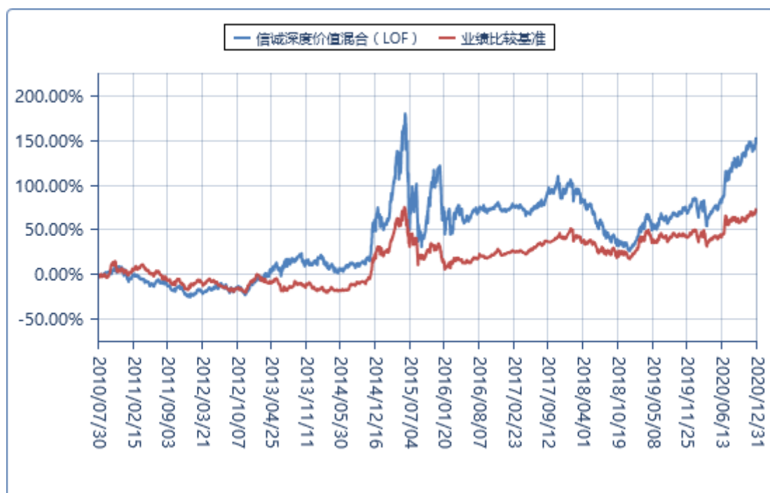
3.2.3 过去五年/自基金合同生效/自基金转型以来基金每年净值增长率及其与同期业绩比较基准收益率的比较