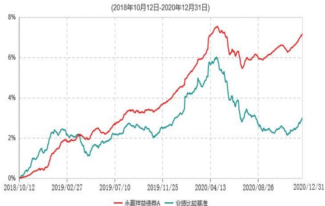
永赢祥益债券A累计净值增长率与业绩比较基准收益率历史走势对比图