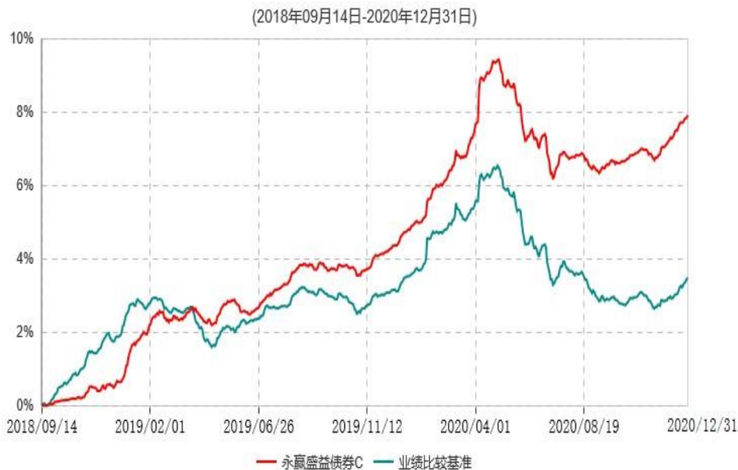
永赢盛益债券C累计净值增长率与业绩比较基准收益率历史走势对比图