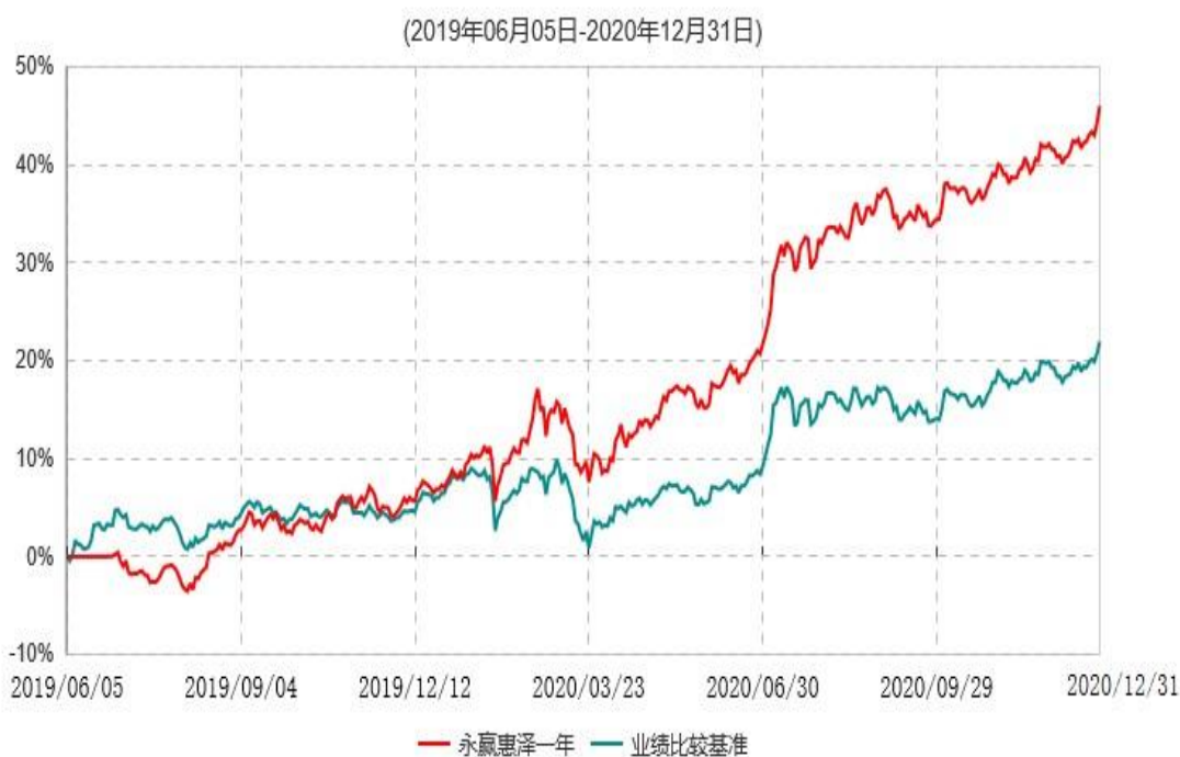
永赢惠泽一年定期开放灵活配置混合型发起式证券投资基金累计净值增长率与业绩比较基准收益率历史走势对比图