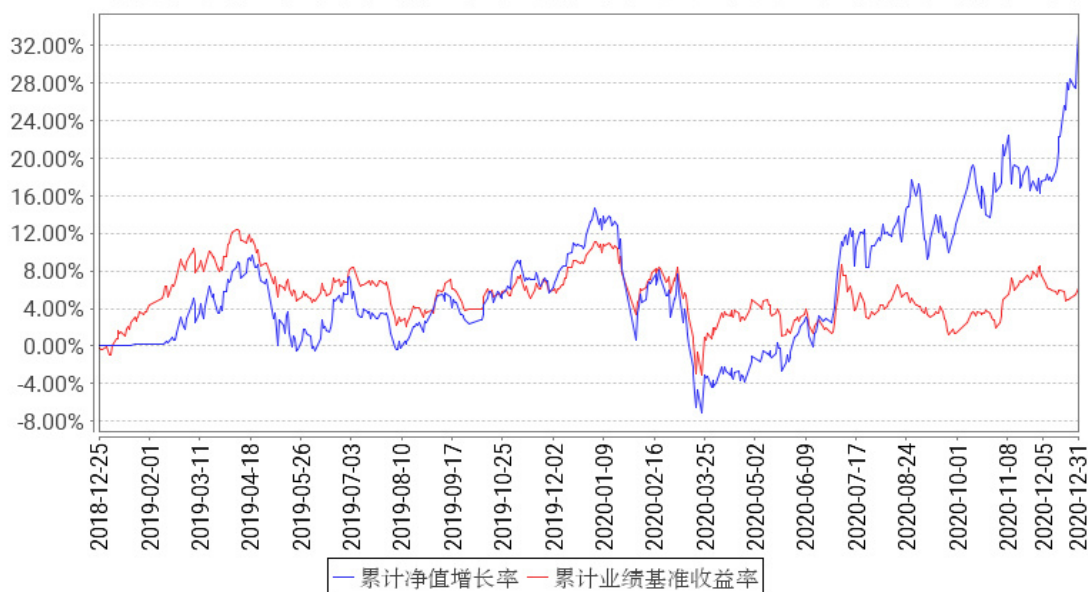
工银红利优享混合A累计净值增长率与同期业绩比较基准收益率的历史走势对比图