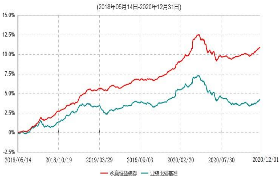
永赢恒益债券型证券投资基金累计净值增长率与业绩比较基准收益率历史走势对比图