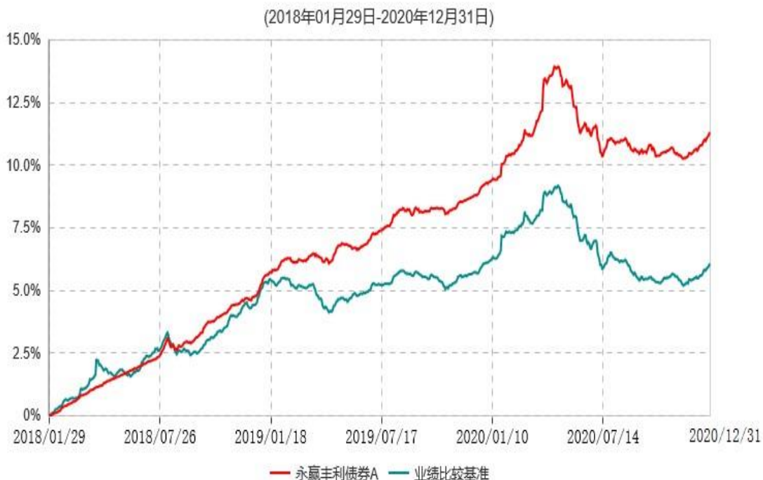
永赢丰利债券A累计净值增长率与业绩比较基准收益率历史走势对比图