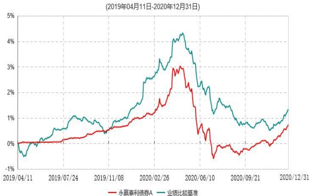
永赢泰利债券A累计净值增长率与业绩比较基准收益率历史走势对比图