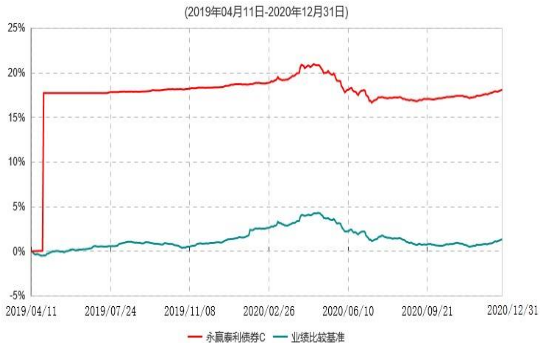
永赢泰利债券C累计净值增长率与业绩比较基准收益率历史走势对比图