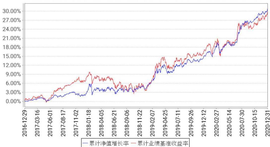
工银新增利混合累计净值增长率与同期业绩比较基准收益率的历史走势对比图